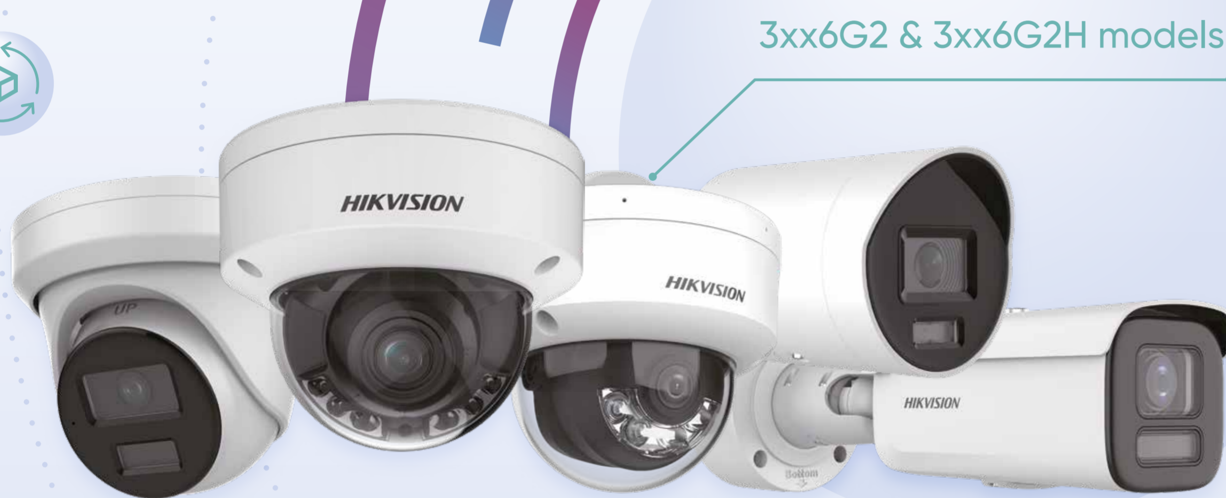
3xx6G2 & 3xx6G2H models