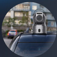
Monté sur un véhicule