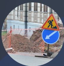
Suivi des urgences