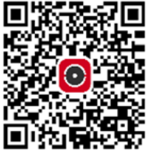
Hik-Connect para usuários