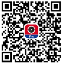
Hik-ProConnect para instaladores

The wall/ceiling is strong enough to withstand three times the weight of the camera and the mount. Some cameras support one port for four switchable signals (TVI/AHD/CVI/ CVBS). Product images are for reference only. For more product information, visit http://www.hikvision.com/ .